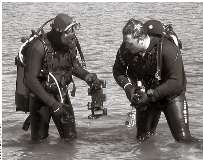
Ķekavas novada Pašvaldības policija pārbauda peldvietas drošumu.