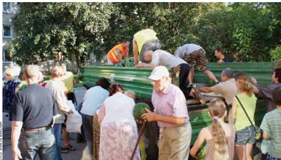
Ķekavas iedzīvotāji priecājas par gardo dienvidzemes sveicienu.