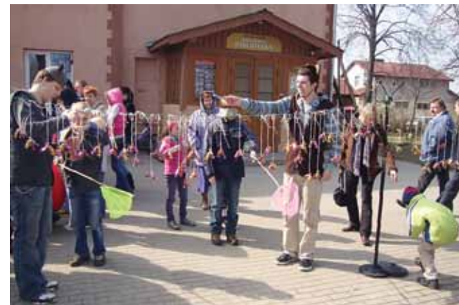
Katlakalnieši ar dažādām izdarībām sagaida Lieldienas.