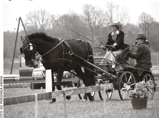
Jaunstrautu komanda piedalās Latvijas Jātnieku federācijas kausa sacensībās.

Šobrīd jau sagādāts profesionāls ekipējums sacensībām, bet galvās rodas arvien jauni nākotnes plāni. Latvijā pajūgu braukšana vēl ir samērā jauns un nezināms sporta veids, taču Jaunstrautu komanda ir pārliecināta, ka piecu gadu laikā tā kļūs arvien populārāka un Latvija spēš izaudzināt