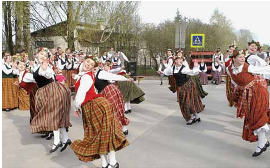
Deju festivālā Katlakalnā mājnieki uzņem draugus no Latvijas novadiem.

Pašā Katlakalna vidū, sirmu liepu ielokā, atrodas Katlakalna Tautas nams. Sens nams ar savu likteņstāstu, brīnišķīgu auru un tradīcijām.