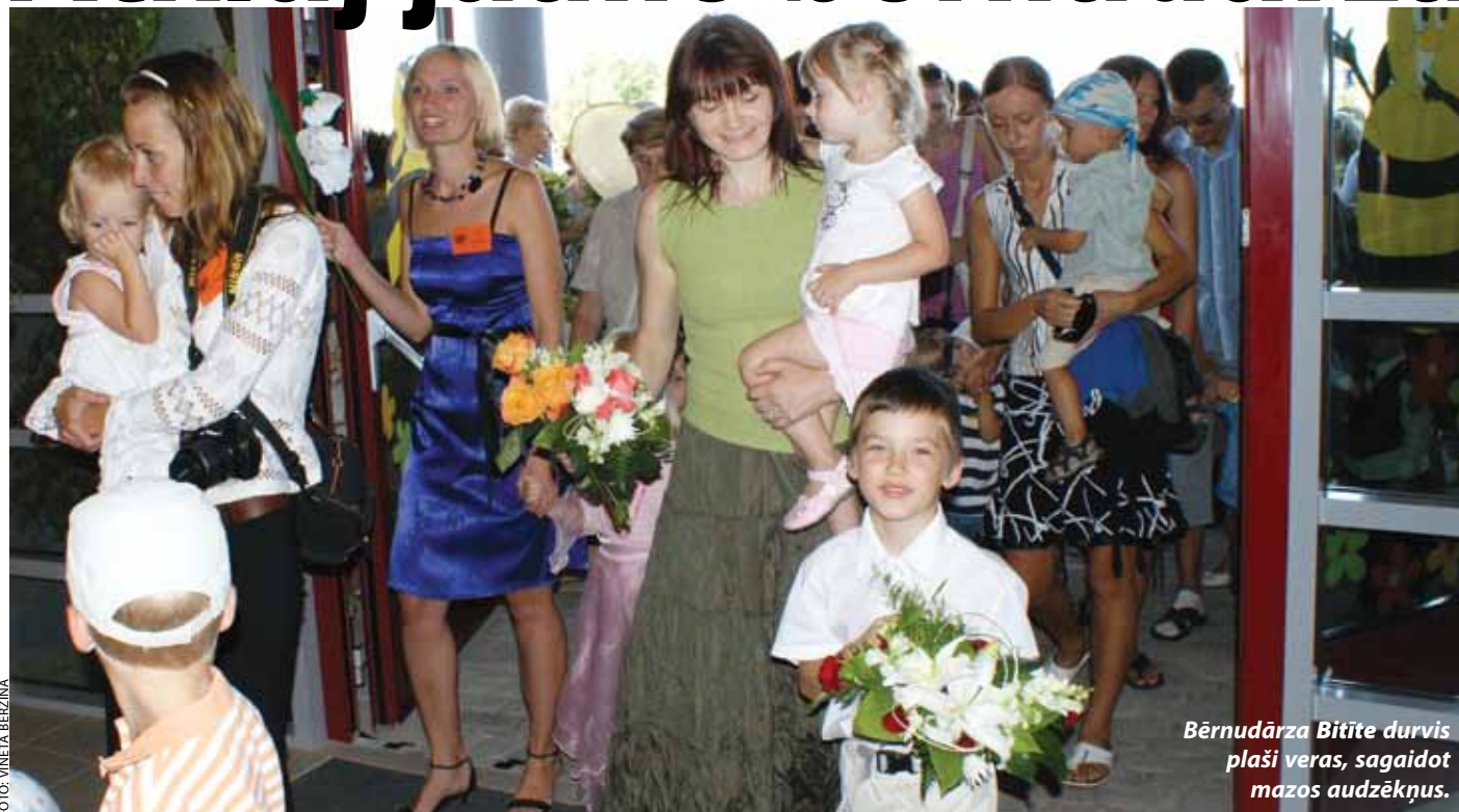
Bērnodārza Bitīte durvis plaši veras, sagaidot mazos audzēkņus.

Saņemot Dieva svētību un uz klausot klātesošo laba vēlējumus, 30. jūlijā svinīgi tika atklāta viena no Ķekavas novada vērienīgākajām būvēm - pirmsskolas izglītības iestāde Bitīte Katlakalnā. Jau šomēnes bērnodārzā dzirdamas vairāk nekā 260 bērnu čalas.