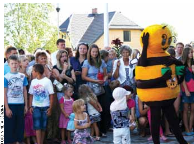
Jauno pirmsskolas izglītības iestādi izpētīt dodas gan bites, gan lielie un mazie novadnieki.